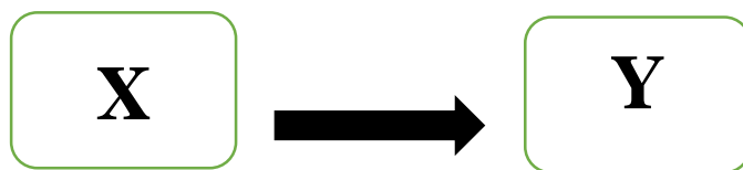
Gambar 3.1 hubungan antara variabel independen dan dependen

Qur'an Santri Pondok Pesantren Tahfidzul Qur'an Al-Hasan Patihan Wetan Babadan Ponorogo Tahun 2022.